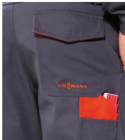
Zahlreiche Taschen für genügend Stauraum