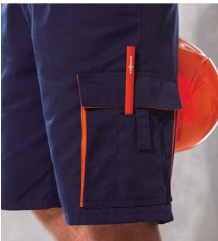
Aufgesetzte Seitentaschen mit integrierter Handytasche