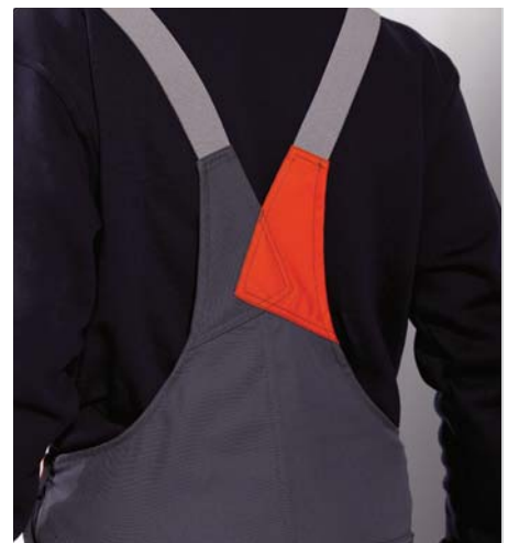
Dehnzone im Rückenteil für größtmögliche Bewegungsfreiheit