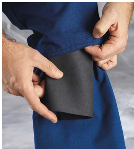
Schützendes Kniepolster Artikel-Nr. Kniepolster: 3320001

Artikel-Nr. Farbe grau: 3000 500 – 3000 556