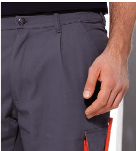
Bund mit eingearbeitetem Gummizug