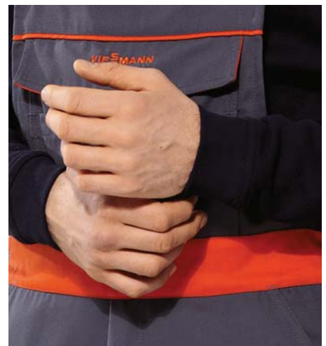
Perfekter Sitz durch Strickbündchen am Hals, Ärmel und Saum